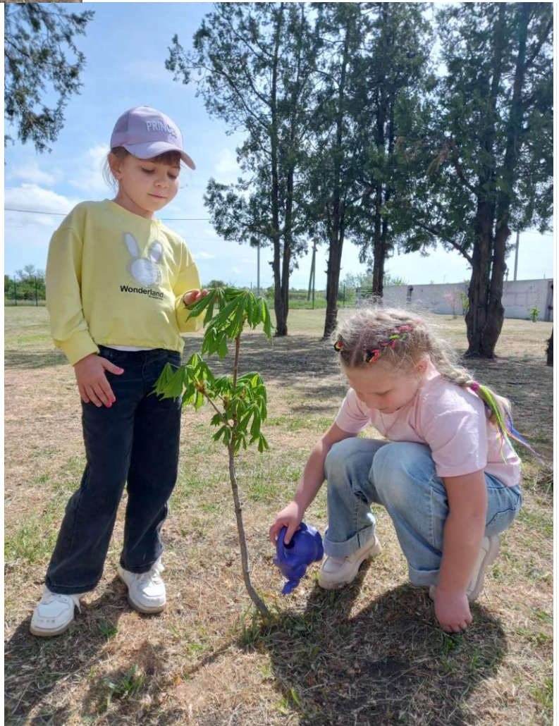
«Поливаем молодые деревца»