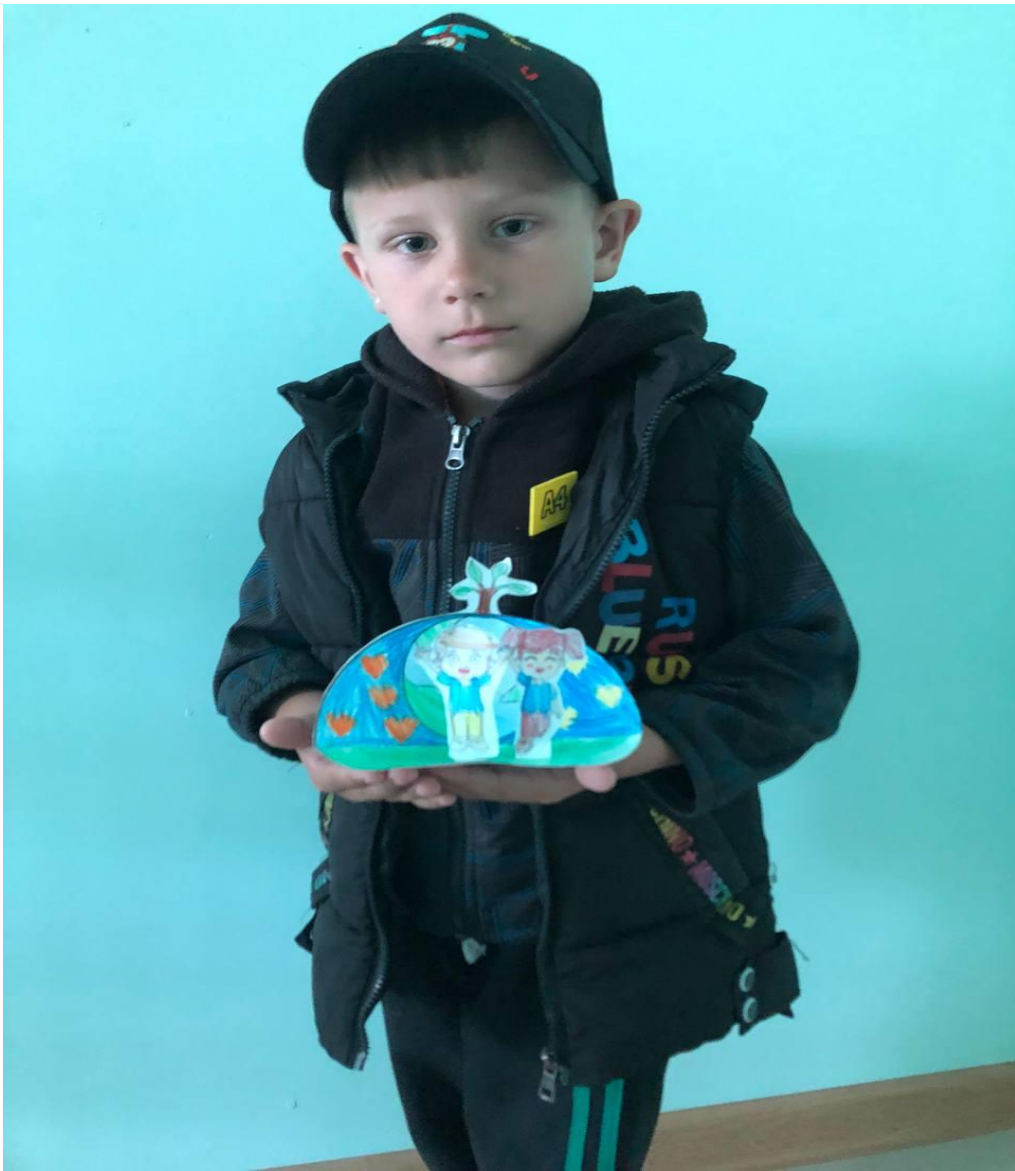
«Красивая планета Земля»