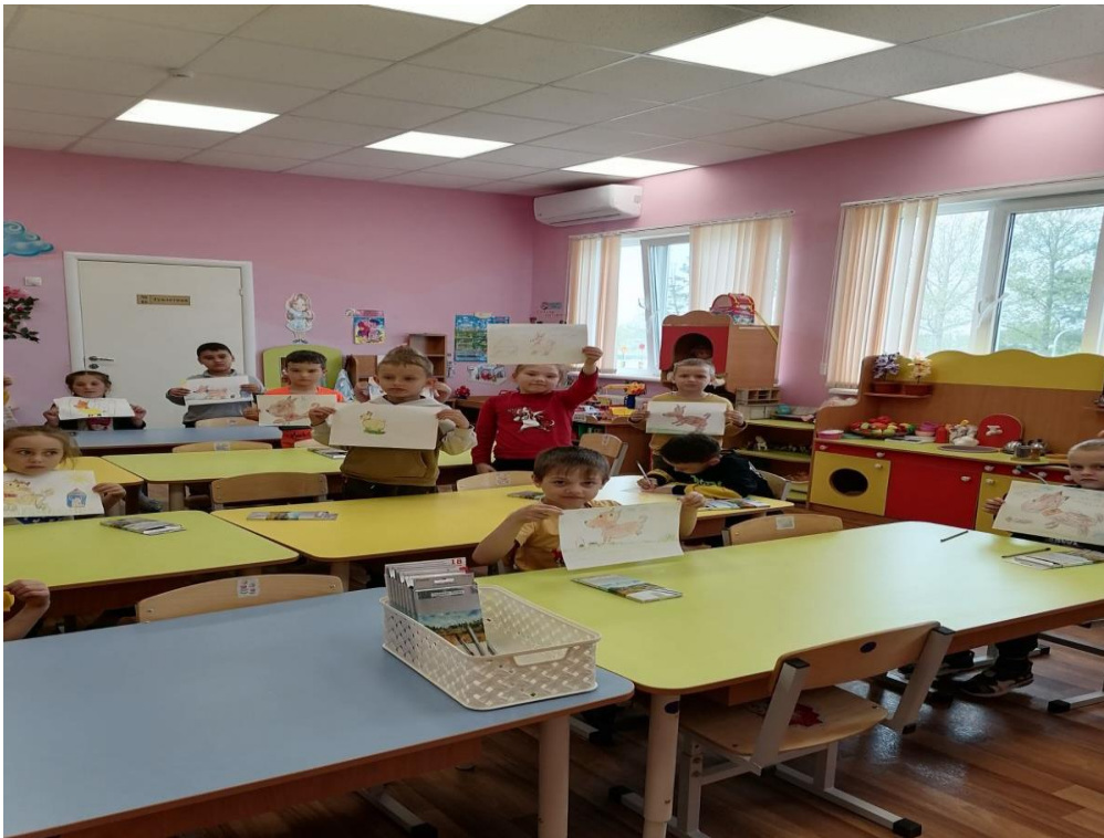
Воспитанники подготовительной группы на занятии рисования