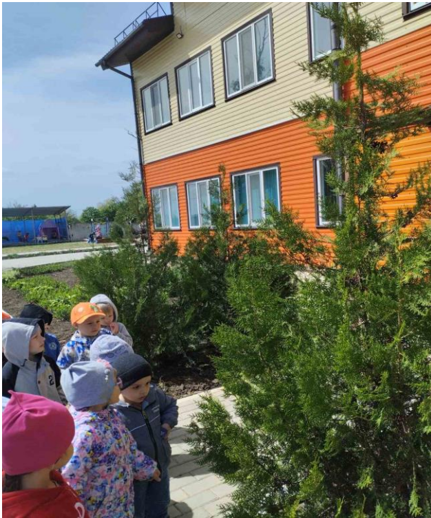
«Какая красивая ель»»